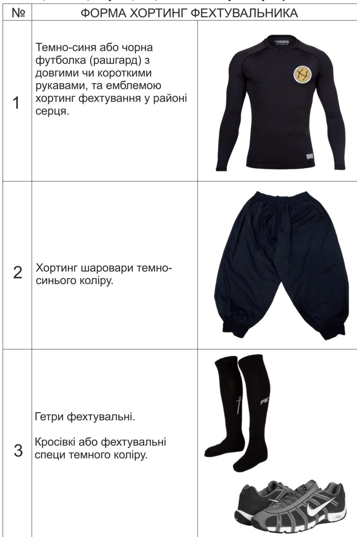
(Таблиця) Форма (одяг) для занять хортинг фехтуванням